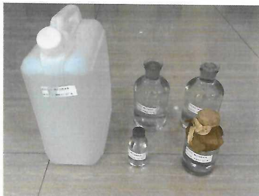
鹤山北控水务四堡水厂出厂水样品