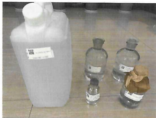
鹤山北控水务四堡水厂出厂水样品